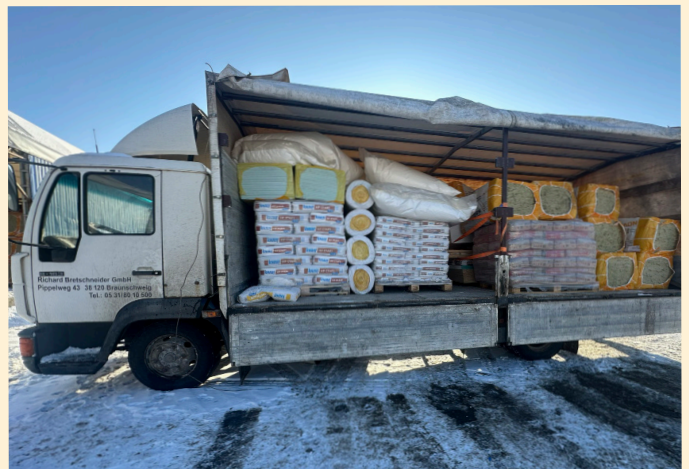
Transport hela vägen till Kharkiv som ligger nära fronten