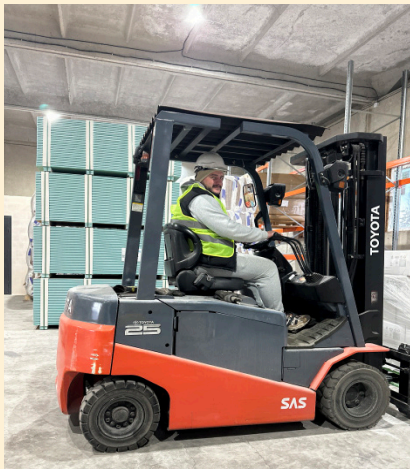
Dagligen sker omlastning på vårt lager i Kyiv